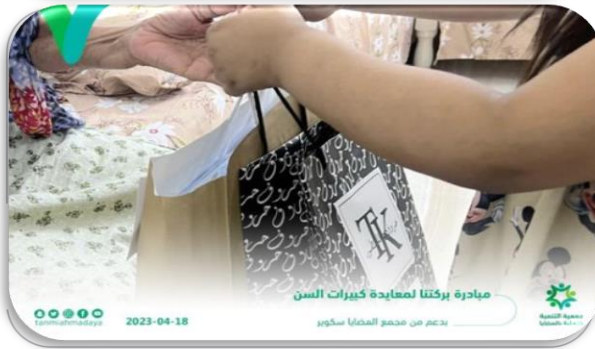
مبادرة بركتنا لمعايدة كبار السن بدعم من مجمع المضيا سكوير