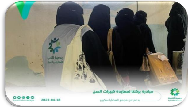
مبادرة بركتنا لمعايدة كبار السن بدعم من مجمع المضيا سكوير