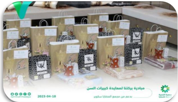
مبادرة بركتنا لمعايدة كبار السن بدعم من مجمع المضيا سكوير