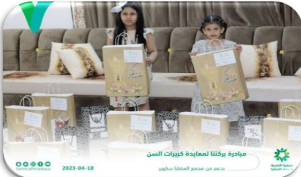
مبادرة بركتنا لمعايدة كبار السن بدعم من مجمع المضيا سكوير